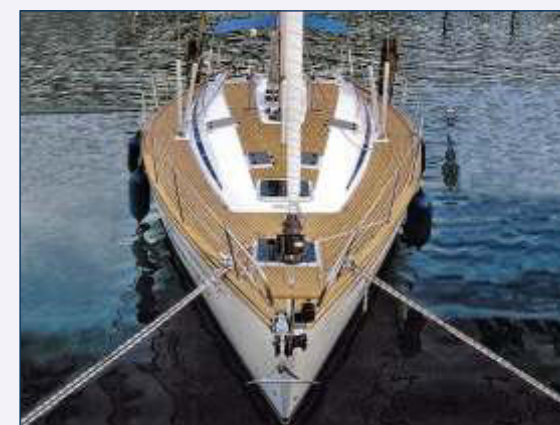
Änderungen und Irrtümer vorbehalten